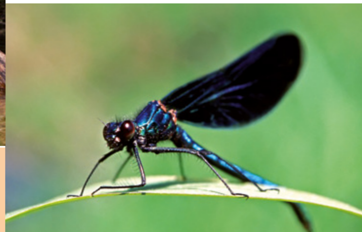
Blauflügel-Prachtlibelle ( Calopteryx virgo )