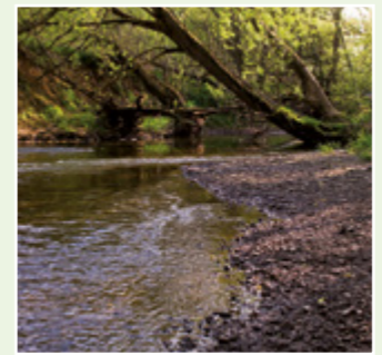
Nutzen Sie die Gewässerzugänglichkeit und erfrischen Sie sich an der Nethe.

Die Kiesbänke außerhalb dieses Bereiches sind wichtige Laichplätze für unsere heimischen Fische und dürfen daher nicht betreten werden.