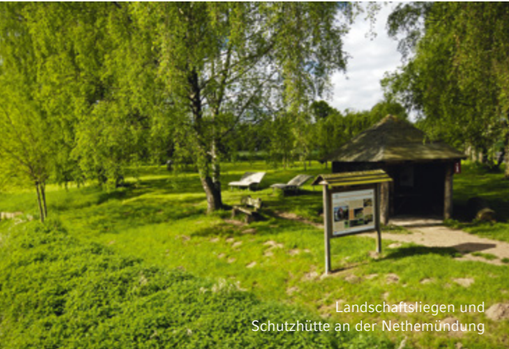
Landschaftsliegen und Schutzhütte an der Nethemündung

Die Kiesbänke außerhalb dieses Bereiches sind wichtige Laichplätze für unsere heimischen Fische und dürfen daher nicht betreten werden.