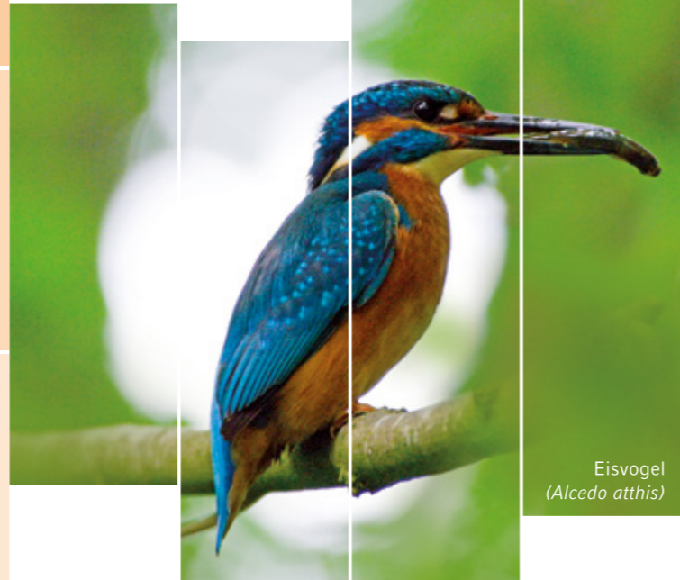
Eisvogel ( Alcedo atthis )