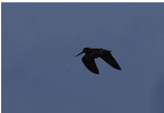
Abb. 2: Waldschnepfe ( Scolopax rusticola ). Ein Archivfoto von Helgoland.

Die Waldschnepfe ist regelmäßiger Brutvogel im Gebiet. Über den Brutbestand, die Durchzügler und die Wintergäste ist wenig bekannt. Im Jahr 2015 kam es zu zehn Nachweisen.