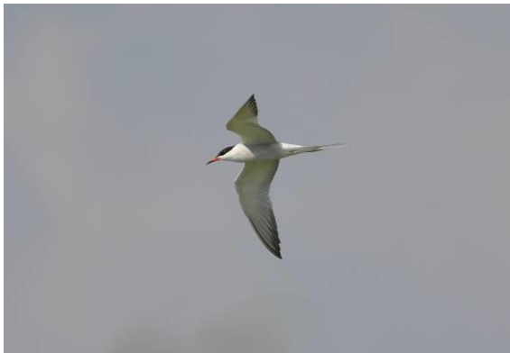
Abb. 5: Flusseeschwalbe ( Sterna hirundo). Eine adulte Seeschwalbe am Freizeitsee Höxter am 10.07.2014.

Die Flusseeschwalbe zieht in geringer Anzahl regelmäßig im Gebiet durch. Im Jahr 2015 wurde ein Vogel beobachtet.