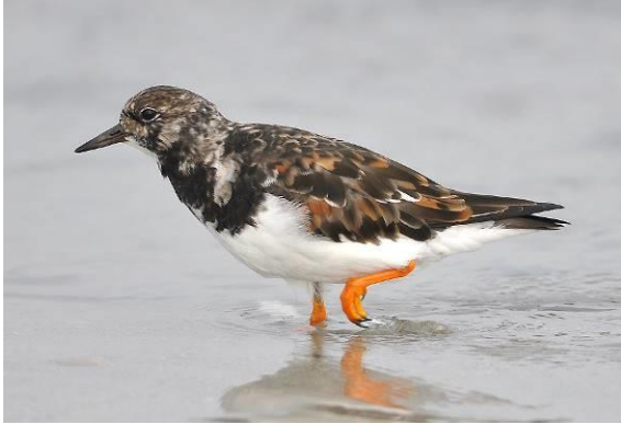
Abb. 3: Steinwalzer ( Arenaria interpres ). Ein Archivfoto von Helgoland.

Der Steinwalzer ist eine Ausnahmerecheinung im Kreis Hoxter. Es handelt sich um den zweiten Nachweis.