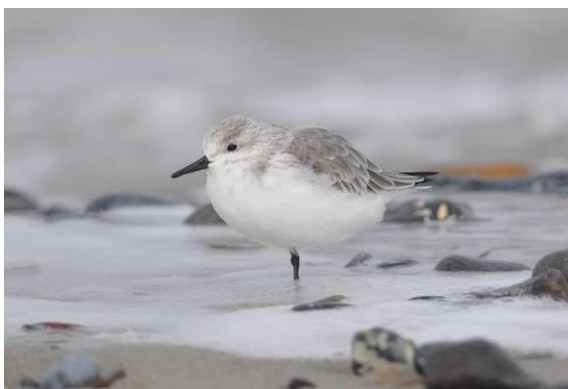
Abb. 4: Sanderling ( Calidris alba ). Ein Archivfoto von Helgoland.

Der Sanderling ist eine Ausnahmerecheinung in der Oberweserniederung. Es handelt sich um den vierten Nachweis für den Kreis Höxter.