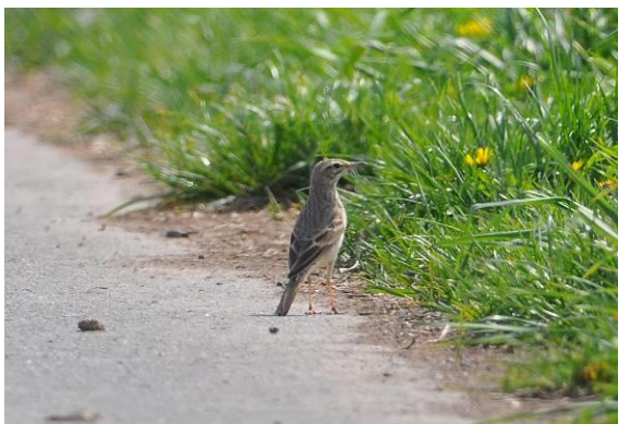
Abb. 7: Brachpieper ( Anthus campestris ;). Ein adulter Pieper am Brökelberg bei Borgentreich am 23.04.2014.

Der Brachpieper ist ein sehr seltener und unregelmäßig festgestellter Durchzügler im Gebiet.