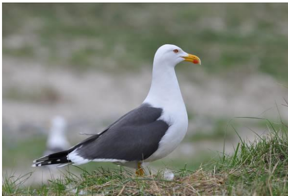
Abb. 5: Heringsmöwe ( Larus fuscus graellsii ). Ein Archivfoto von Helgoland.

Der Heringsmöwe ist ein seltener unregelmäßiger Durchzügler im Gebiet. Im Jahr 2015 gelangen zwei Beobachtungen.