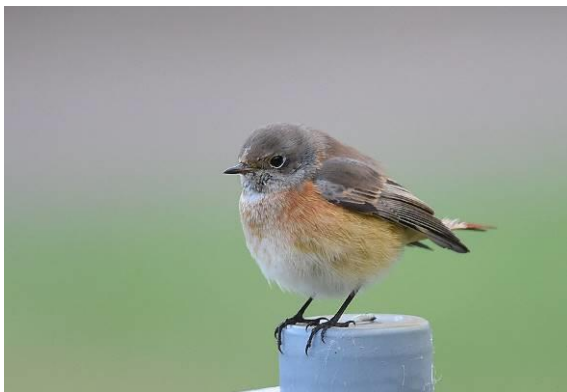
Abb. 6: Gartenrotschwanz ( Phoenicurus phoenicurus ). Ein Archivfoto von Helgoland.

Der Gartenrotschwanz ist inzwischen ein extrem seltener Brutvogel im Gebiet. Zusätzlich werden jährlich einige Exemplare auf dem Durchzug beobachtet. Im Jahr 2015 kam es mit dreiundzwanzig Beobachtungen zu erstaunlich vielen Nachweisen. Die Feststellungen im Mai und Juni liegen im Brutzeitfenster. Allerdings können hier späte Durchzügler bzw. unverpaarte, vagabundierende Männchen ohne eine Zweitbeobachtung im Abstand von sieben Tagen nicht ausgeschlossen werden. Im Jahr 2015 wurden zwei Brutnachweise bekannt!