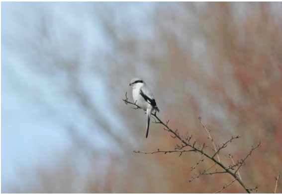
Abb. 11: Raubwürger an den Lühtringer Kieselseen am 16.03.2013