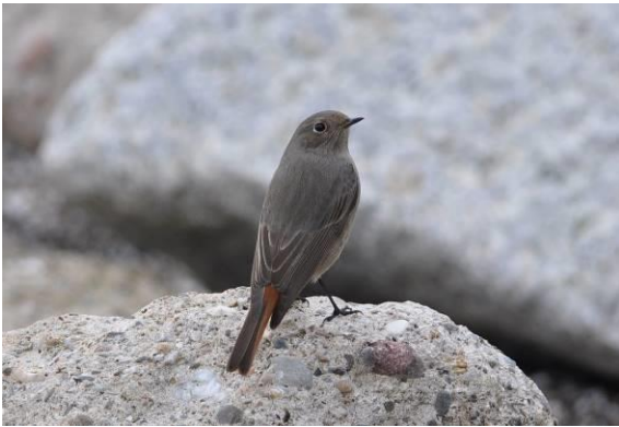
Abb. 13: Hausrotschwanz - ein Archivfoto von Helgoland