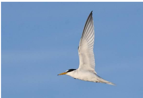
Abb. 6: Zwergseeeschwalbe - ein Archivfoto von Schleswig-Holstein

Die Zwergseeeschwalbe tritt als Ausnahmererscheinung im Gebiet auf. Es handelt sich um den dritten Nachweis. Der Nachweis wurde von der Avikom NRW anerkannt.