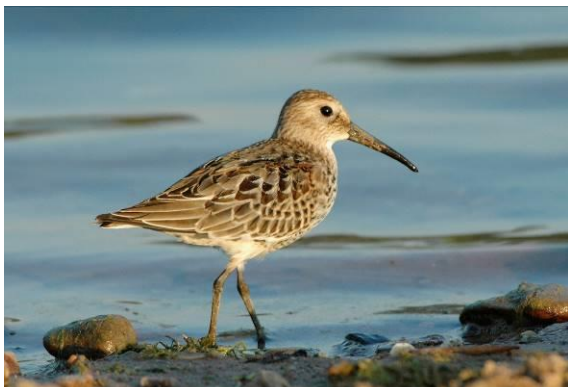
Abb. 5: Alpenstrandläufer

Der Alpenstrandläufer kann regelmäßig bei der Rast in der Oberweserniederung und an den Klärteichen der Zuckerfabrik Warburg beobachtet werden. Bemerkenswert ist ein Trupp von acht Individuen am 21.09.2016 bei Lauenförde.