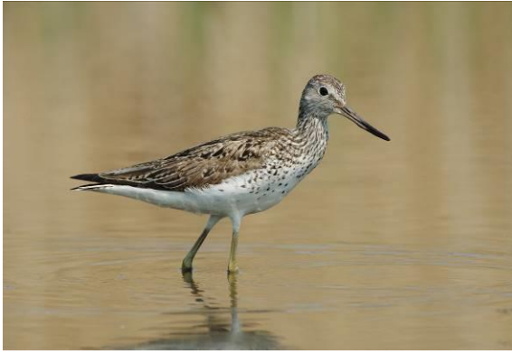
Abb. 4: Grünschenkel