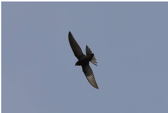
Abb. 9: Mauersegler - ein Archivfoto von Mallorca

Der erste Mauersegler wurde am 19.04.2016 und die letzten Mauersegler am 04.09.2016 beobachtet.