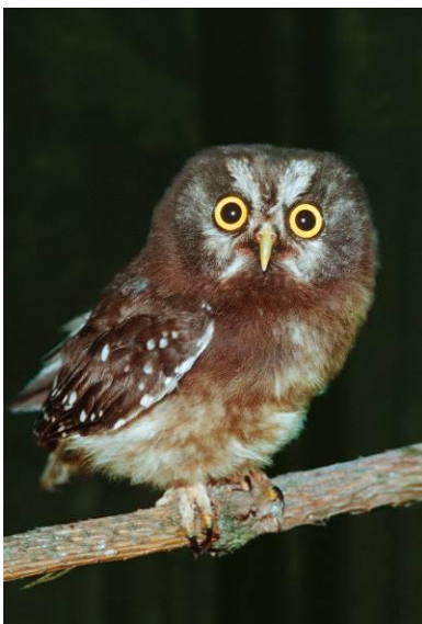
Abb. 8: Raufußkauz

Der Raufußkauz ist ein seltener Brutvogel im Eggegebirge. Der diesjährige Nachweis liegt von diesem nicht weit entfernt.