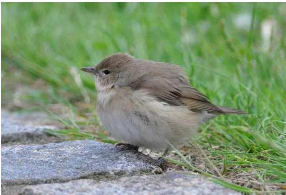
Abb. 12: Gartengrasmücke - ein Archivfoto von Helgoland

Die Gartengrasmücke ist regelmäßiger Brutvogel und Durchzügler im Gebiet. In der Tabelle sind die erste und letzte Beobachtung des Jahres 2016 dargestellt.