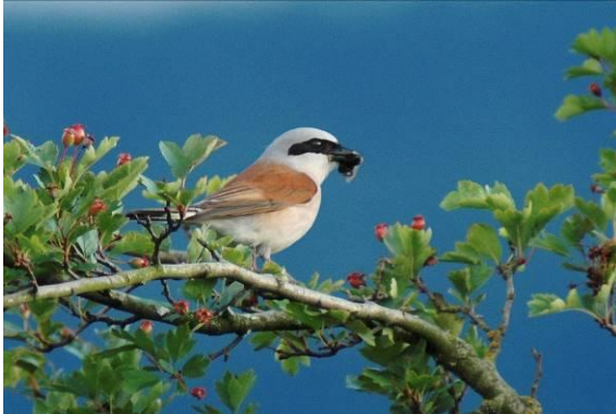
Abb. 10: Neuntöter

Der Neuntöter ist ein regelmäßiger Brutvogel und Durchzügler im Gebiet. Der erste Neuntöter des Jahres wurde am 16.04.2016 sowie der letzte am 13.09.2016 beobachtet. Hierbei handelt es sich um einen späten Nachweis.