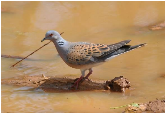
Abb. 7: Turteltaube - ein Archivfoto von Griechenland