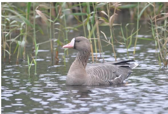
Abb. 1: Blässgans - ein Archivfoto von Helgoland

Die Blässgans ist regelmäßiger Durchzügler und Wintergast im Gebiet. Im Jahr 2016 rastete nur einmal ein Trupp von elf Gänsen. Ferner hielten sich zwei Gänse zwischen dem 20.01. und dem 11.05.2016 in der Weseraue zwischen Höxter und Meinbrexen (HOL) auf.