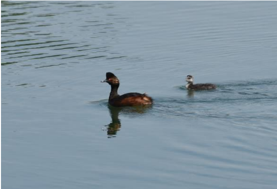
Abb. 3: Schwarzhalstaucher mit einem Küken auf einem Kiessee bei Lauenförde am 02.08.2015

Der Schwarzhalstaucher ist ein seltener und unregelmäßiger Durchzügler im Gebiet. Seit 2010 wird die Art im Kreis Höxter öfter beobachtet. Ob dies mit der intensiveren Beobachtungsaktivität oder auf ein verändertes Verhalten der Schwarzhalstaucher im Großraum zu tun hat, bleibt weiterhin ungewiss. Im Jahr 2016 gelangen vier Beobachtungen auf dem Durchzug und im zweiten Jahr brütete der Schwarzhalstaucher nun mit zwei Paaren auf den Kiesseen bei Lauenförde (HOL).